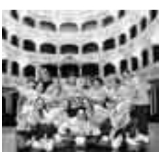
I BALLERINI DI AUGUSTA

Risultato prestigioso nella categoria Teen che ottiene un meritato primo posto. La giuria composta da 15 maestri