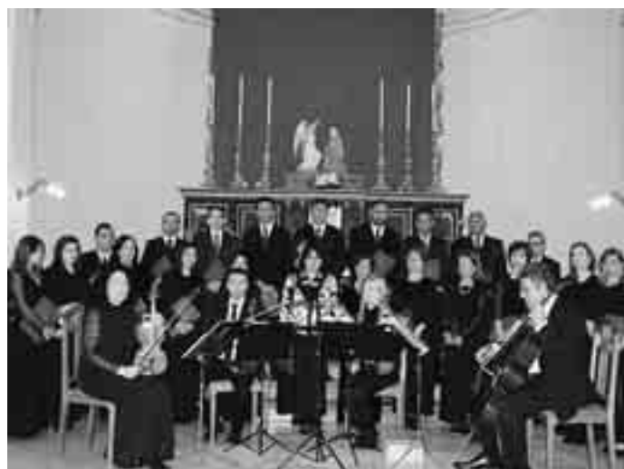
I CORISTI DELLA POLIFONICA EUTERPE DURANTE L'ESIBIZIONE IN CHIESA