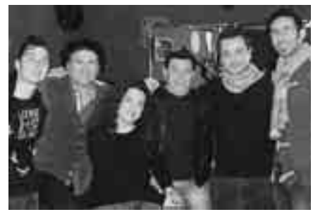
IL GRUPPO DEI BALLARÒ BAND