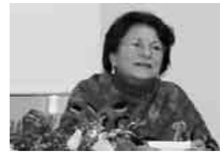
IL PRESIDENTE GIOIA PACE