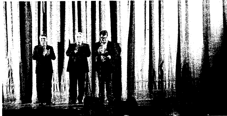
UN MOMENTO DELLA PRESENTAZIONE DELLO SPETTACOLO